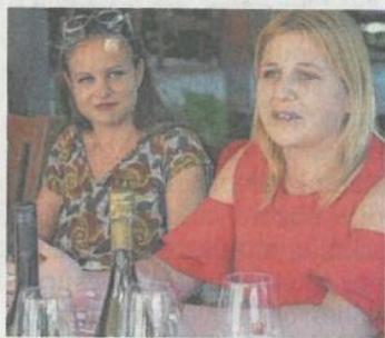
Nedűk társaságában a sajtótájékoztatón

DEBRECEN. Augusztus első hetében zenével és a szőlőnedű fűszeres illatával telik meg a Békás-tó környéke, ugyanis ekkor rendezik meg a Debreceni Bor- és Jazznapokat. A négynapos dzsempori programjait csütörtökön ismertették. 12. HBN