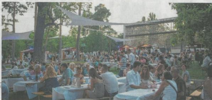
Idén is sokan kilátogattak a programra