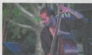
A finom borok mellé remek zene szól