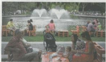
Kellemes környezetben időzhetnek a vendégek