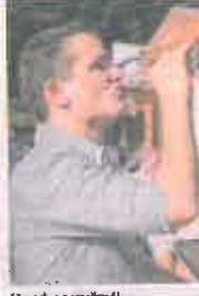
Hátradva a vörösnél