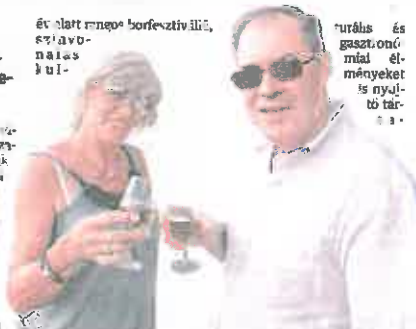
Jó óhosszú könyörgő borok... évről a napot és hagyd a gyaradtságot... Hozzátartozóknak tisztelettel...

és alatt magyar borérvényekkel, szlovén és magyar borokkal folytatódik.