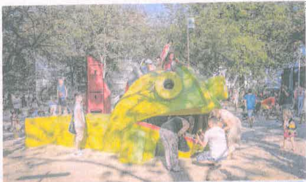
Fesztiválhangulat a Nagyerdőn Birtokba vette a nagyközönség a megújult Békás-tó környékét a hétvégén rendezett borkarnevállal; nem csak a felnőttek, de a gyerekek is megtáiták a kedvükre való elfoglaltságot /6.

Z r k ink cért süt- it a rója nk- nu- dta: irző oz- zen- ság- s az yke- ; is gaz- pol- jén- ni a TÁBE