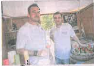
Örültek, hogy vidéki és helyi borok voltak a borkóstolón