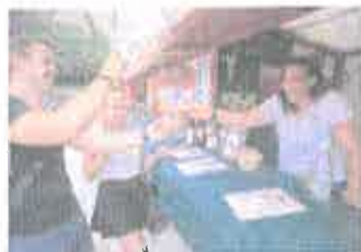
Az eső ellenére is remek hangulatban a nyitó napon

na te- rar in- jk- iz- zst ot- to- en. -PA