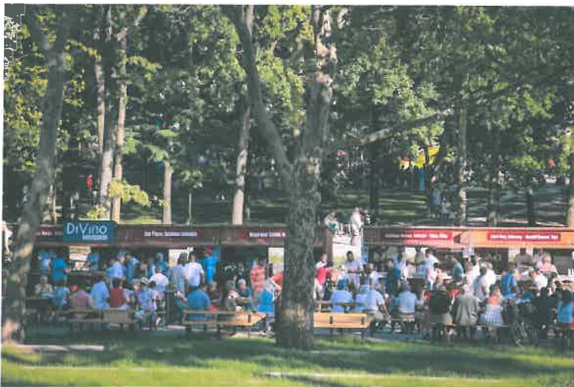
Borkarnevál a Nagyerdőn

Borkarneváltra járni jó dolog! Szép a felújított Békás-tó, finomak a borok, sok ismerőssel lehet találkozni, jó zene szól. Aki kint volt a hétvégén, és figyelt a részletekre is, a felújítással kapcsolatban sok kritikát, kérdést hallhatott. Orosz Csaba írása.